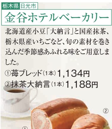
北海道産小豆「大納言」と国産抹茶、栃木県産いちごなど、旬の素材を巻き込んだ季節感あふれる味をご用意しました。