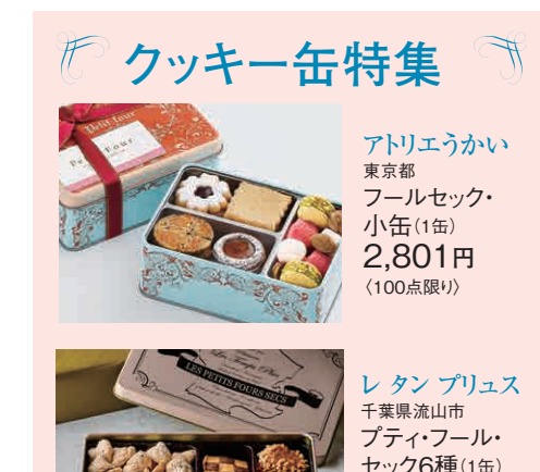
アドリエウカい 東京都 フールセック・小缶(1缶) 2,801円 (100点限り)