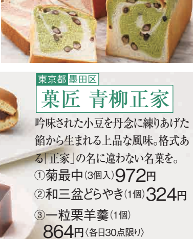
①苺ブレッド(1本) 1,134円 ②抹茶大納言(1本) 1,188円