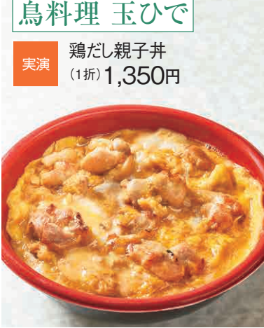
鶏だし親子丼(1折) 1,350円