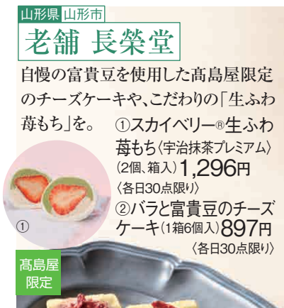
老舗 長榮堂 自慢の富貴豆を使用した高島屋限定のチーズケーキや、こだわりの「生ふわもち」を。