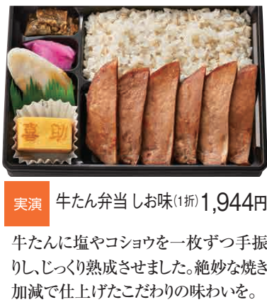
牛たんに塩やコショウを一枚ずつ手振りし、じっくり熟成させました。絶妙な焼き加減で仕上げたこだわりの味わいを。