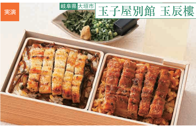
選り抜いたうなぎをふっくら焼きあげた白焼きと、あっさりとしたタレで繊細に味つけたひつまぶしを一折でお楽しみいただけます。あい盛りまぶし(1折) 3,240円