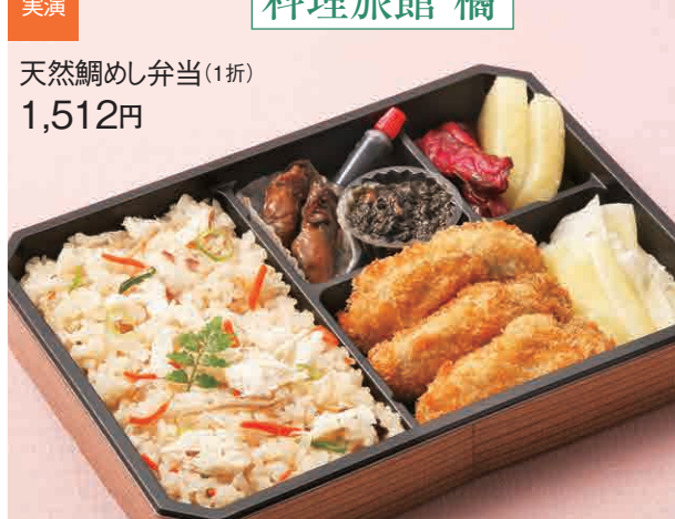
天然鯛めし弁当(1折) 1,512円