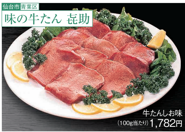
牛たんしお味(100g当たり) 1,782円