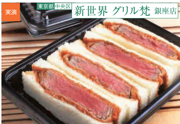
ビーフヘレカツサンド(1折・4切) 1,200円