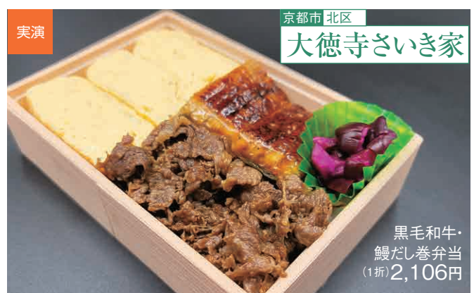
黒毛和牛・鰻だし巻弁当(1折) 2,106円