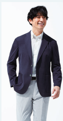
▶ [ガビアーティ] イタリア製スーツ・ ドロークードスーツ各種 42,900円 (40点限り)