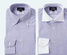
◀ [L.クラティコ] ワイシャツ各種 5,940円