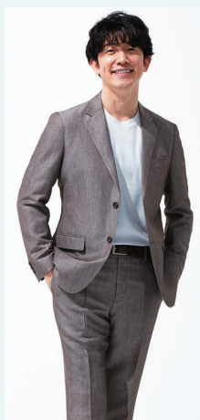
▲ [ケントアヴェニュー] ジャケット 33,000円 パンツ 16,500円

■5月1日(水)→6日(月・休) ■11階 催会場 ※連日午前10時30分から午後7時30分まで開催。最終日は午後6時閉場。