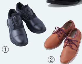
◀ [有名ブランド] 紳士靴 モアサイズ バリエーション特集 (23.0~30.0cm) ① 5,500円 ② 8,800円