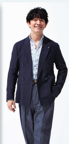
▲ [タリアトーレ] ジャケット 51,700円 [オリアン] シャツ 19,800円 [クラウディオマリアーニ] パンツ 14,520円