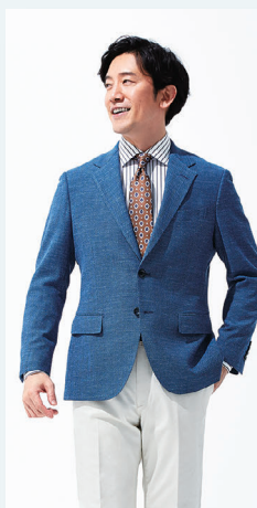
▲ [ケントアヴェニュー] ジャケット 38,500円 パンツ 11,500円