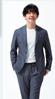
◀ [グローバル テラリング] ジャケット 35,200円 パンツ 13,200円 シャツ 8,800円