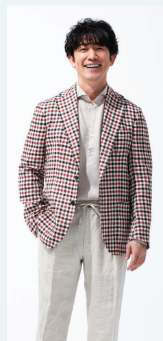
▲ [テイトアレグレット] ジャケット 55,000円 [オリアン] シャツ 17,050円 [クラウディオマリアーニ] パンツ 15,400円