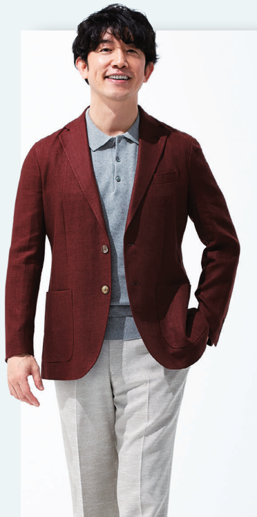
▲ [グローバルテラリング] ジャケット 44,000円 パンツ 14,300円 ポロシャツ 7,700円