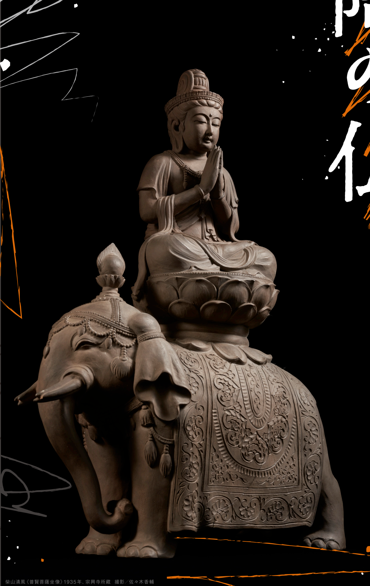
柴山清風〈普賢菩薩坐像〉1935年、宗興寺所蔵