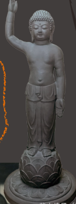
柴山清風《釈迦誕生仏像》1945年頃，大善院所蔵