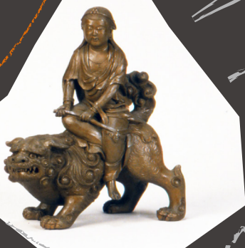
雷本梅月《文殊菩薩像》1912～1926年頃 とこなめ陶の森資料館所蔵

本展では、常滑焼の歴史に西洋彫刻の近代的技法が取り入れられ、それが見事に昇華されていくさまを概観することで、そのハイブリッドな陶彫の興味深い歴史をご紹介します。そして同時に、近代常滑の陶彫と仏像についての再考も試みたいと思います。仏像というのは、何も飛鳥時代や中世の古い時代に制作されたものだけに限ったものではないということ、近代に入って制作された新しい仏、それも木彫ではなく陶彫からなる仏にも独特な面白さがあるのだということを感じていただければ幸いです。