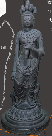
柴山清風《十一面観音菩薩像》1945年頃，大善院所蔵