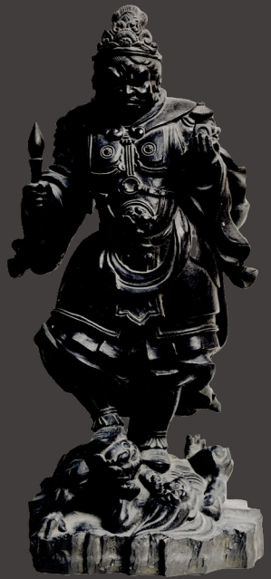
片岡陶楽《多聞天立像》1925～1950年頃 大善院所蔵