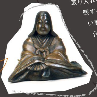
鯉江方寿《玉織姫座像》1844年 とこなめ陶の森資料館所蔵，半田市立博物館画像提供