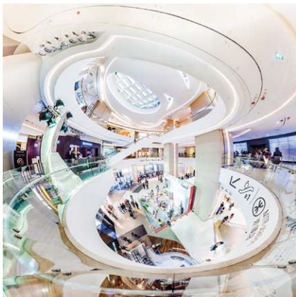
『Hysan Place 希慎廣場』(大山頭, 2015年)

ショッピングモールとは、都市であり、宇宙である。そして、想像力の源泉である。 百貨店展に続く今回のモール展では、ショッピングモールの文化的意義を考察してみたいと思います。これまで文化批評の文脈で、モールは社会を均質化し、古くからある商店街を虚げる存在として批判の対象となってきたことが多いように思います。しかし、私たちは、今日においてモールはむしろカルチャーを育む土壌であり、文化的象徴でさえあるのではないかと考えています。それは即ち、現代の都市における最も重要な公共圏であり、私たちの日々の生活の不可分な一部であることを意味します。 モールという箱に入れば、そこはまるで一つの都市のように、ストリートに沿ってアパレルショップや雑貨店、フードコート、映画館、広場などが展開され、吹き抜けからそれらを一望すると、人々の日常の最大公約数がここに凝縮されていることが再確認できます。こうした空間であることが、多くのアーティストたちの想像力を刺激するのも無理はありません。 本展は「ショッピングモールはユートピアだ」という仮説をもとに、「街」「内と外の反転」「ユートピア」「バックヤード」といったいくつかのテーマを切り口に、モールという消費空間が私たちのイメージネーションにどのように働きかけ、どのような文化的価値を創造してきたのかを読み解いてみようとする試みです。展示室には、膨大なテキストと共に、映画、音楽、コミック、小説、ゲームなど、モールを舞台としたさまざまなジャンルの作品が、あたかも巻物がひもとかれたかのように出現します。本展サブタイトルに掲げたように、モールこそが私たちの夢見たユートピアであったのかどうか、ぜひみなさまの目で確かめていただきたいと思います。また本展が、ショッピングモールの一考察として、モールの新たな側面に光をあてることのできる契機となれたなら幸いです。