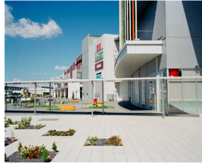
『MALL #17』(小野啓, 2012年)