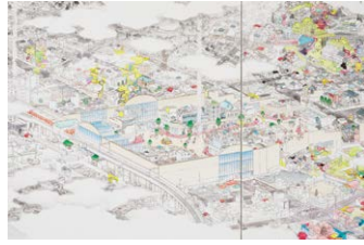
『ショッピングモール (部分)』 (山口晃, 2015年-) 複製パネルを展示 撮影: 本暮伸也 ©YAMAGUCHI Akira, Courtesy of Mizuma Art Gallery