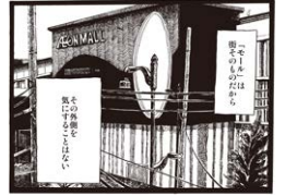
『イオンにみせられて』 (もぐこん, 2017年)

ショッピングモールとは、都市であり、宇宙である。そして、想像力の源泉である。 百貨店展に続く今回のモール展では、ショッピングモールの文化的意義を考察してみたいと思います。これまで文化批評の文脈で、モールは社会を均質化し、古くからある商店街を虚げる存在として批判の対象となってきたことが多いように思います。しかし、私たちは、今日においてモールはむしろカルチャーを育む土壌であり、文化的象徴でさえあるのではないかと考えています。それは即ち、現代の都市における最も重要な公共圏であり、私たちの日々の生活の不可分な一部であることを意味します。 モールという箱に入れば、そこはまるで一つの都市のように、ストリートに沿ってアパレルショップや雑貨店、フードコート、映画館、広場などが展開され、吹き抜けからそれらを一望すると、人々の日常の最大公約数がここに凝縮されていることが再確認できます。こうした空間であることが、多くのアーティストたちの想像力を刺激するのも無理はありません。 本展は「ショッピングモールはユートピアだ」という仮説をもとに、「街」「内と外の反転」「ユートピア」「バックヤード」といったいくつかのテーマを切り口に、モールという消費空間が私たちのイメージネーションにどのように働きかけ、どのような文化的価値を創造してきたのかを読み解いてみようとする試みです。展示室には、膨大なテキストと共に、映画、音楽、コミック、小説、ゲームなど、モールを舞台としたさまざまなジャンルの作品が、あたかも巻物がひもとかれたかのように出現します。本展サブタイトルに掲げたように、モールこそが私たちの夢見たユートピアであったのかどうか、ぜひみなさまの目で確かめていただきたいと思います。また本展が、ショッピングモールの一考察として、モールの新たな側面に光をあてることのできる契機となれたなら幸いです。