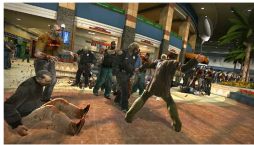
『デッドライジング』(2006年) ©CAPCOM CO., LTD. 2006, 2016 ALL RIGHTS RESERVED.