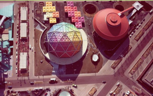
1. みどり館俯瞰,1970年

1970年の大阪万博を紹介する本展では、高島屋がみどり会として共同出展したパビリオン「みどり館」に焦点をあてます。エントランスホールでは吉原治良監修による具体美術展が開催。館内には、全天周映画の鑑賞体験ができる「アストロラマ」(アストロ「天体」とドラマ「劇」を合わせた造語)がありました。放映された映画は、当時珍しかった海外取材や水中撮影なども豊富に取り入れられ、脚本を谷川俊太郎、音楽を黛敏郎、そこに舞踏家土方巽が登場するという、非常に前衛的なものでした。このたびは、パビリオン「みどり館」のメイキング映像とともに、放映された映画「誕生」の一部再現映像を展示します。