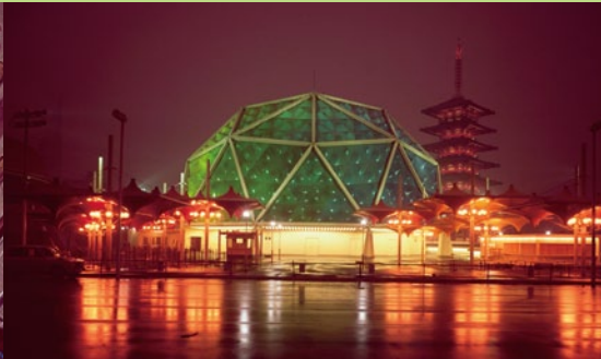
2. みどり館夜景,1970年