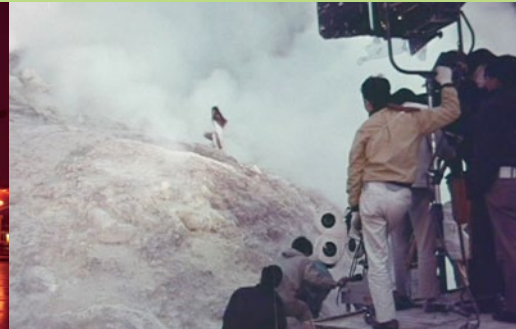
3. 『アストロラマを創る』1970,記録映像より

【関連イベント】 ※全てに事前予約が必要です。予約は右記HPから受付けています。 https://www.takashimaya.co.jp/shiryokan/tokyo