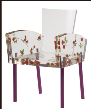
デザイン: 倉俣史朗 《Miss Blanche (ミス・ブランチ)》 (1988) ©KURAMATA DESIGN OFFICE photo by Hiroyuki MORI