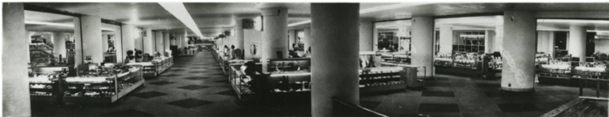
■ニューブロードフロア写真