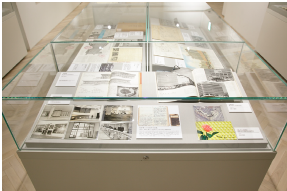
■写真、絵葉書、掲載雑誌など