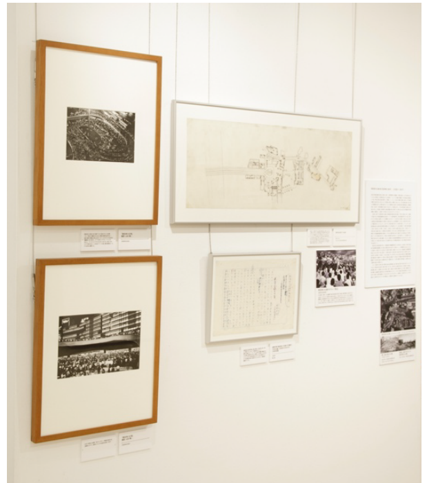
■インタビュー映像、写真、図面、竣工パンフレットなど