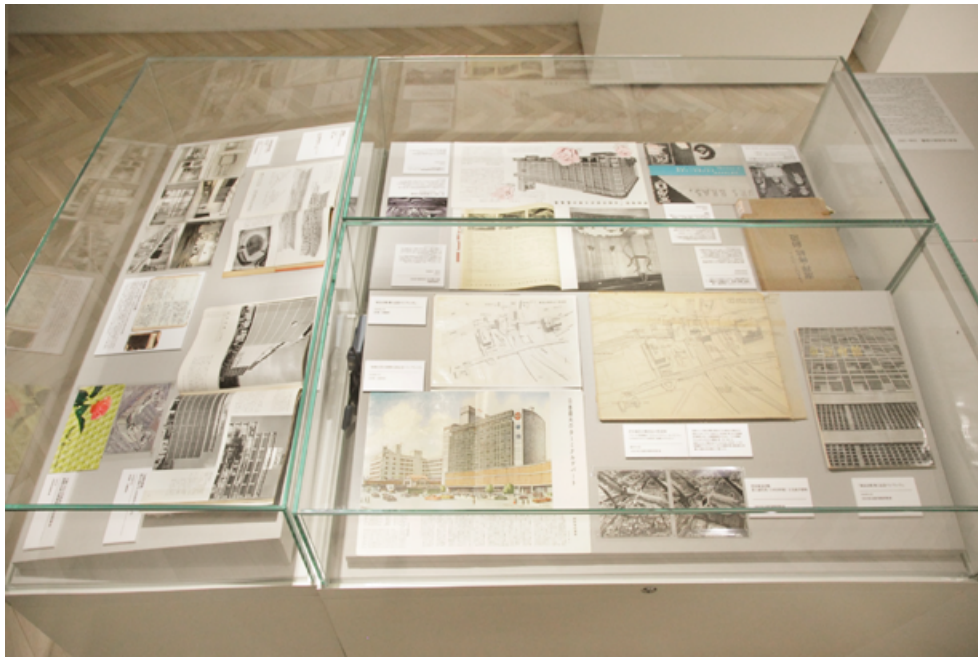
■竣工パンフレット、図面、写真など