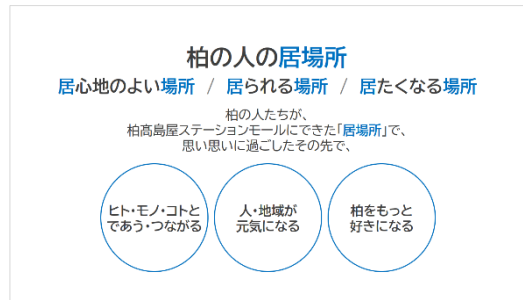
※コンセプト説明図

「柏の人の居場所」をコンセプトに新設いたします。これまで買い物や食事をして過ごす場所だった柏高島屋ステーションモール。ここに“柏の人の居場所”となるコミュニティスペースが新たに加わります。〈学ぶ〉〈働く〉〈遊ぶ〉〈挑戦する〉〈伝える〉など、ひとりひとりの様々な行為や気持ちの受け皿となること、施設の賑わいを地域へ還元し、地域の賑わいを施設に取り込むような、“賑わいの循環拠点”となることを目指します。