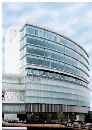
※左から本館、S館、新館