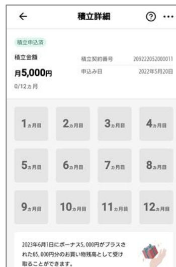
スゴ積み「積立詳細」画面