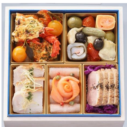
日本酒と合うお重