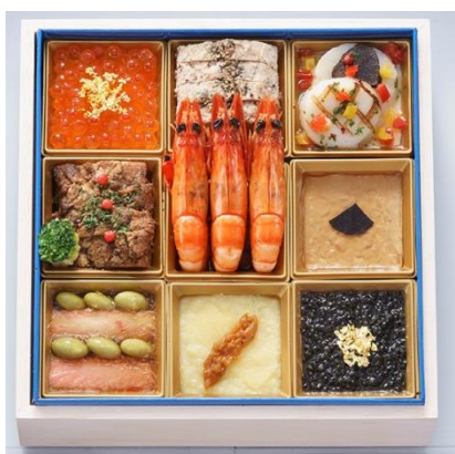
シャンパンに合うお重

大晦日のカウントダウンパーティーにオススメしたい、シャンパンに合う料理を詰め合わせた一の重。元日の朝、日本酒に合わせてお楽しみいただきたい二の重。元日の夜、ワインに合わせてお楽しみいただきたい三の重。三國清三シェフ監修により、年越しからお正月の乾杯シーンをイメージし、それぞれのお酒に合わせたシェフならではの洋風おせち料理を詰め合わせました。