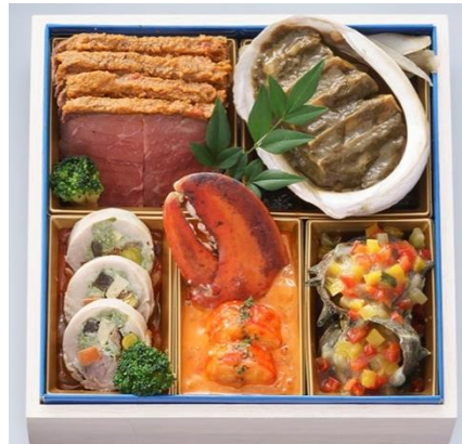
ワインと楽しみたいお重